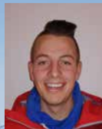
Moritz Kübler - Ski -